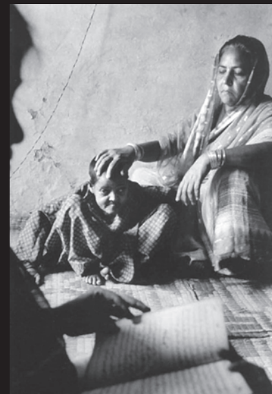
गैस से बुरी तरह प्रभावित एक बच्चा

जहरीली गैस के संपर्क में आने वाले ज्यादातर लोग गरीब कामकाजी परिवारों के लोग थे। उनमें से लगभग 50,000 लोग आज भी इतने बीमार हैं कि कुछ काम नहीं कर सकते। जो लोग इस गैस के असर में आने के बावजूद जिंदा रह गए उनमें से बहुत सारे लोग गंभीर श्वास विकारों, आँख की बीमारियों और अन्य समस्याओं से पीड़ित हैं। बच्चों में अजीबो-गरीब विकृतियाँ पैदा हो रही हैं। इस चित्र में दिखाई दे रही लड़की इस बात का उदाहरण है।