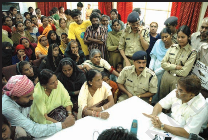
गैस राहत मंत्री से बात करते गैस पीड़ित।

सबूतों से पूरी तरह साफ़ था कि इस महाविनाश के लिए यूनिन कार्बाइड ही दोषी है, लेकिन कंपनी ने अपनी गलती मानने से इनकार कर दिया।