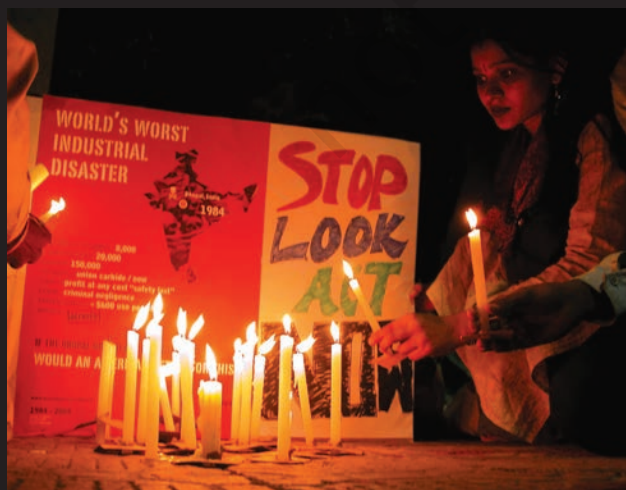
इंसाफ़ की लड़ाई अभी जारी है...।

24 साल बाद भी लोग न्याय के लिए संघर्ष कर रहे हैं। वे पीने के साफ़ पानी, स्वास्थ्य सुविधाओं और यूनिन कार्बाइड के जहर से ग्रस्त लोगों के लिए नौकरियों की माँग कर रहे हैं। उन्होंने यूनिन कार्बाइड के चेयरमैन एंडरसन को सज़ा दिलाने के लिए भी आंदोलन चलाया है।