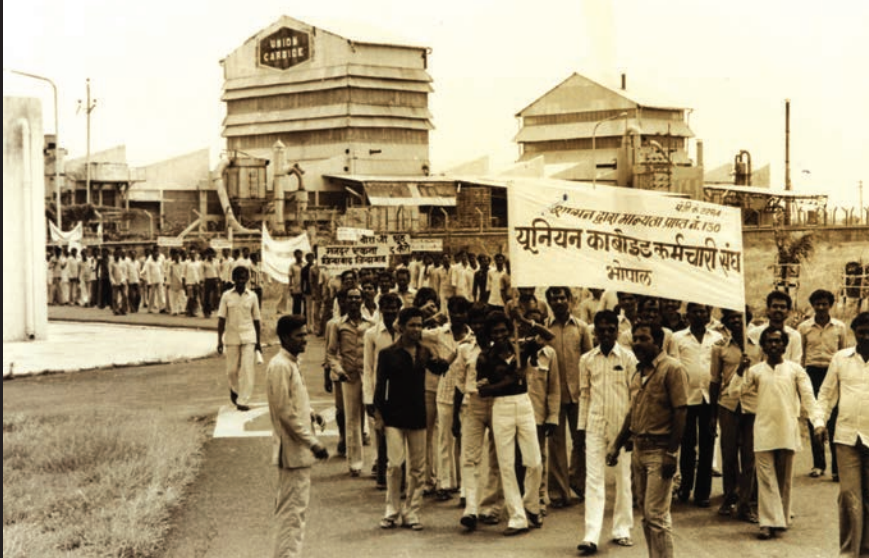
यूनिन कार्बाइड कर्मचारी यूनिन के सदस्यों का आंदोलन

यह तबाही कोई दुर्घटना नहीं थी। यूनिन कार्बाइड ने पैसा बचाने के लिए सुरक्षा उपायों को जानबूझकर नज़रअंदाज़ किया था। 2 दिसंबर की त्रासदी से बहुत पहले भी कारखाने में गैस का रिसाव हो चुका था। इन घटनाओं में एक मजदूर की मौत हुई थी जबकि बहुत सारे घायल हुए थे।