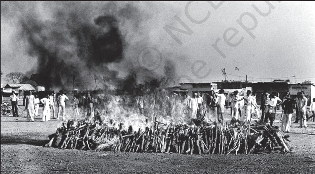
सामूहिक अंतिम संस्कार

तीन दिन के भीतर 8,000 से ज्यादा लोग मौत के मुँह में चले गए। लाखों लोग गंभीर रूप से प्रभावित हुए।