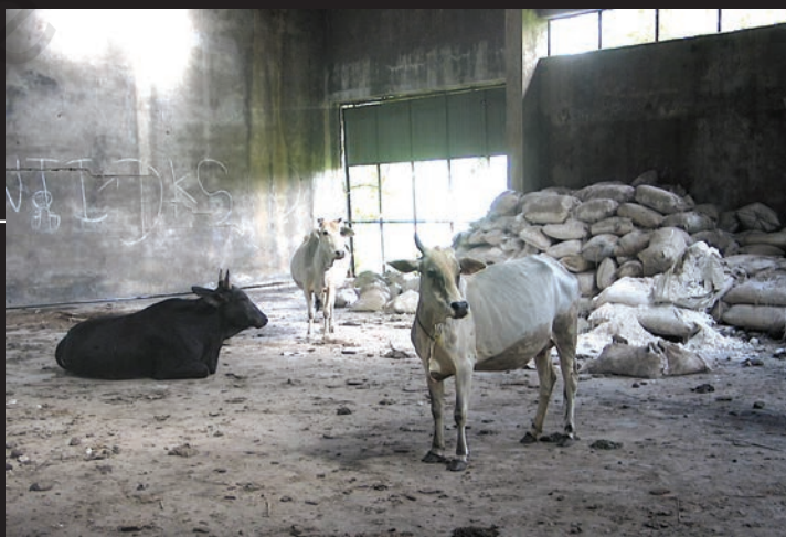
यूनिन कार्बाइड संयंत्र के इर्द-गिर्द बिखरे पड़े रसायनों के बोरे

यूनिन कार्बाइड ने कारखाना तो बंद कर दिया, लेकिन भारी मात्रा में विषैले रसायन वहीं छोड़ दिए। ये रसायन रिस-रिस कर ज़मीन में जा रहे हैं जिससे वहाँ का पानी दूषित हो रहा है। अब यह संयंत्र डाओ कैमिकल नामक कंपनी के कब्ज़े में है जो इसकी साफ़-सफ़ाई का ज़िम्मा उठाने को तैयार नहीं है।